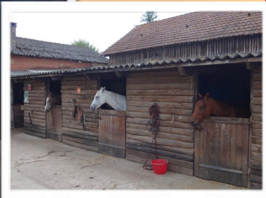
Rémy au boulot !