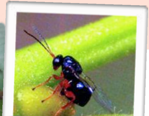
Charmante bestiole !!!