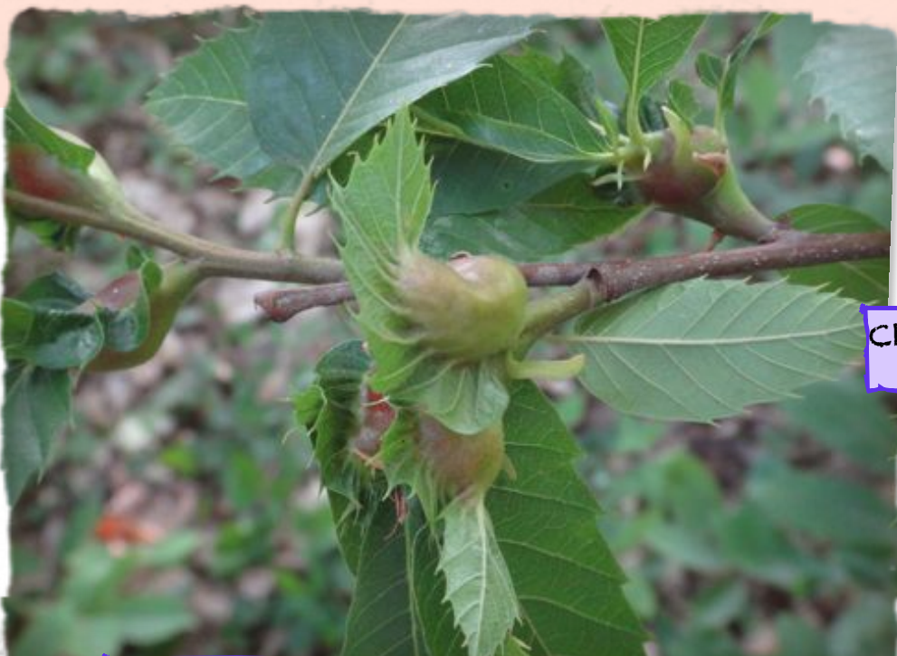
Exemples de gales en plein développement

Actuellement, il n'existe aucun traitement préventif mais des études sont faites depuis quelques années avec un prédateur nommé Torymus sinensis . A priori, c'est le seul qui permettrait de réguler le nombre de cynips. Ces recherches datent de 1982 au Japon, les premiers lâchés ont été effectués en Italie courant 2005. En France, la lutte est également en cours, de nombreux lâchés ayant été effectués en 2015 malheureusement c'est une lutte qui coute très cher et actuellement c'est la seule solution pour sauver la castanéiculture.